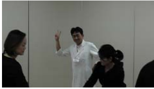
ちょっと、リラックス・・・