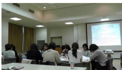
ケーススタディの様子