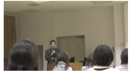
皆さんに開催のご挨拶・・・

講師陣は、ELNEC-J 指導者養成プログラム（日本緩和医療学会主催）を修了しており、また『ELNEC-J コアカリキュラム教育プログラム』や『がん診療に携わる医師のための緩和ケア研修』を修了した看護師や医師がファシリテーターを担当しています。