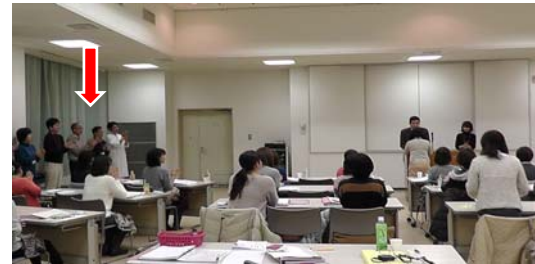
担当者も陰から一緒にお疲れ様でしたの拍手・・・