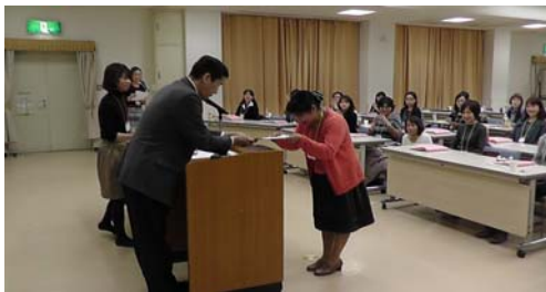
お疲れ様でした・・・