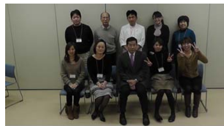
ELNEC-J コアカリキュラム教育プログラム研修担当者