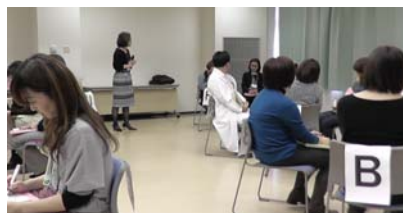
ロール・プレイ後のグループワークの様子