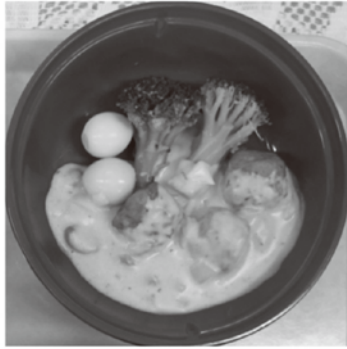
クリームソースを使った当院のメニュー 【つくねのクリームソースがけ】

今回は、アレンジ自在のカレー風味クリームソースをご紹介します！市販品を使って、簡単に作れるレシピです。当院では、鶏つくねにかけて「つくねのクリームソースがけ」として提供しています。他にも、白身魚、野菜など、いろいろな食材にかけてお楽しみいただけます。